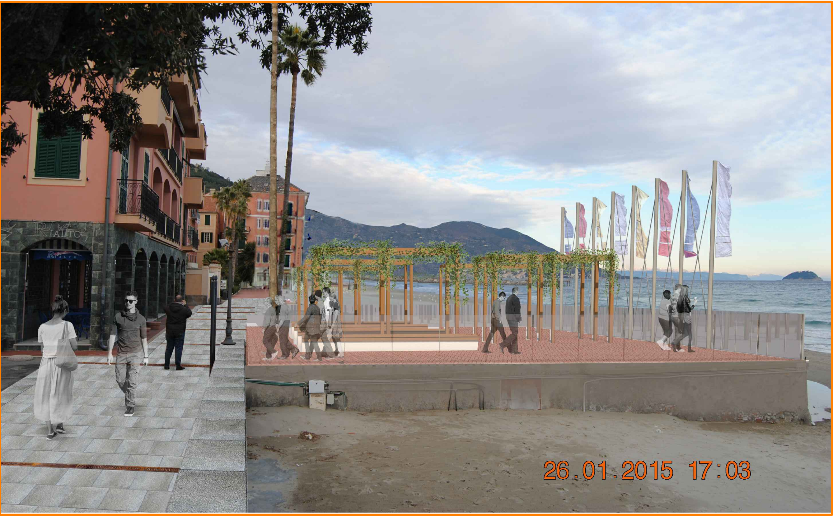
FOTOINSERIMENTO 03 - PROGETTO