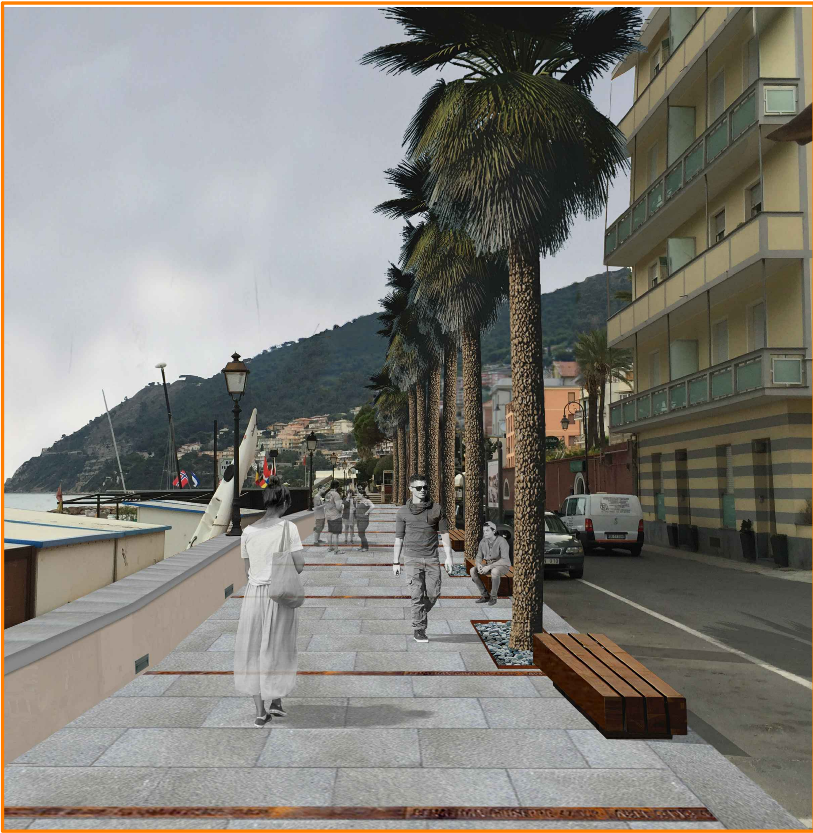
FOTOINSERIMENTO 01 - PROGETTO