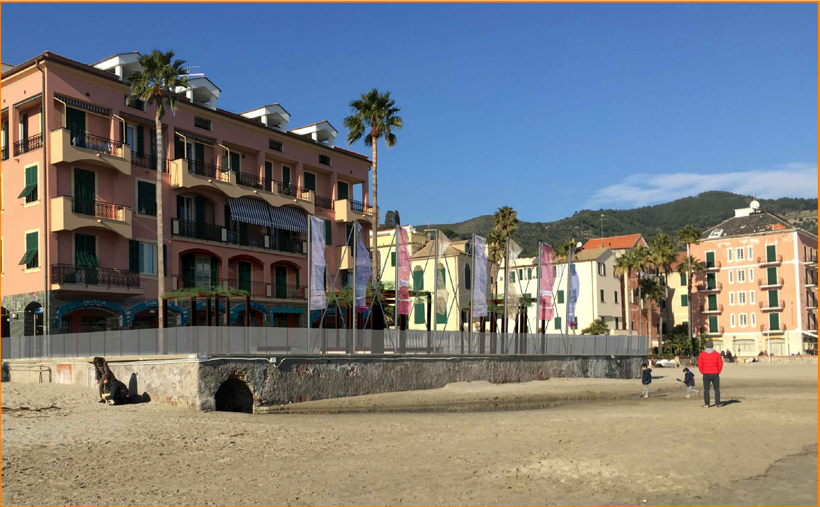
FOTOINSERIMENTO 04 - PROGETTO