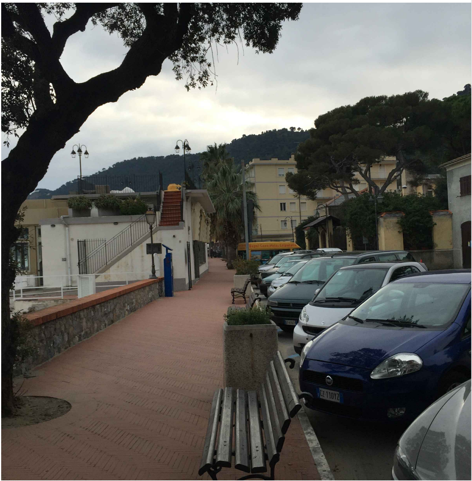
FOTO 02 - STATO ATTUALE