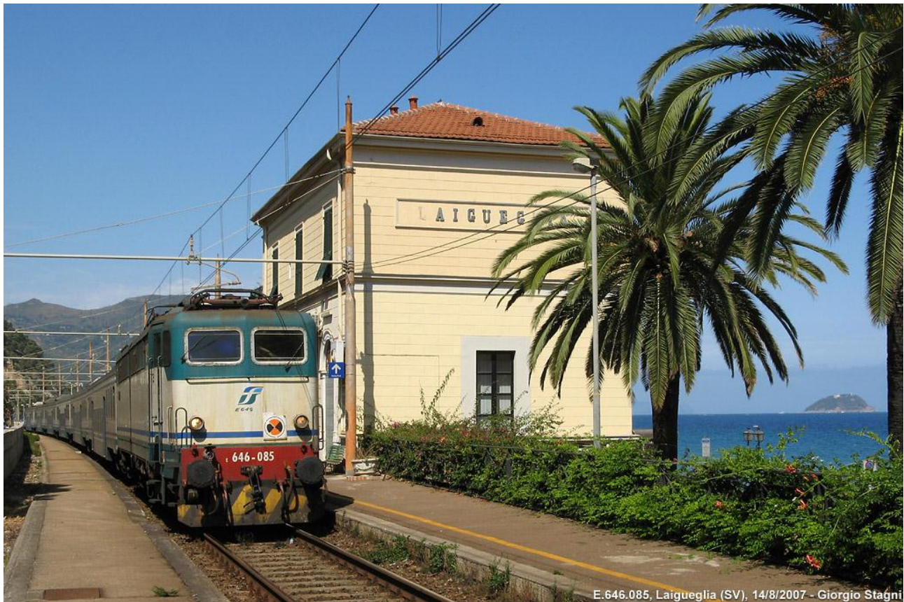
E.646.085, Laigueglia (SV), 14/8/2007 - Giorgio Stagni