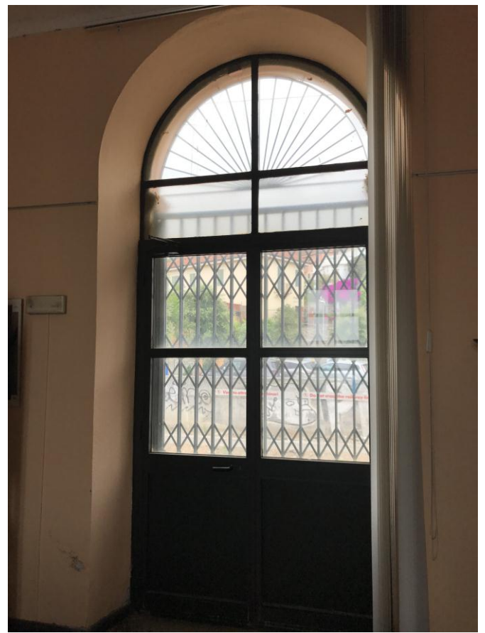
Foto 09 – 10 Il pavimento in "Graniglie" e i serramenti da sostituire

Particolare attenzione va fatta nella sostituzione dei serramenti oggi di fattura moderna ( per il materiale alluminio anodizzato) se pur su disegno originario che potranno certamente essere sostituiti, mantenendo il disegno originario ma con materiali più consoni al valore dell'immobile quali legno o ferrofinestra a taglio termico per migliorare le prestazioni energetiche dell'immobile e garantire abitabilità nella nuova destinazione d'uso. Le ampie finestre lato binario presentano saracinesca in ferro zincato non congruo con i caratteri del luogo che dovrebbe essere rimossa. Si prescrive compatibilmente con le somme a disposizione la sostituzione delle ampie portafinestre ad arco presenti lato binario e la rimozione della serranda scorrevole con ferrofinestra a taglio termico per migliorare ed eventuale cancellata di sicurezza in ferro battuto.