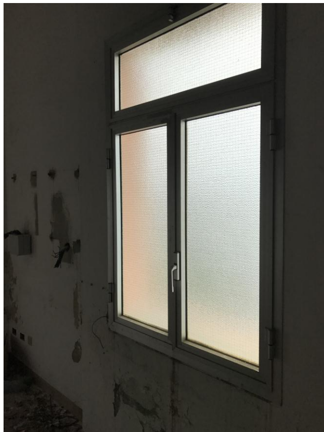
Foto 10-11 I serramenti incongrui da sostituire