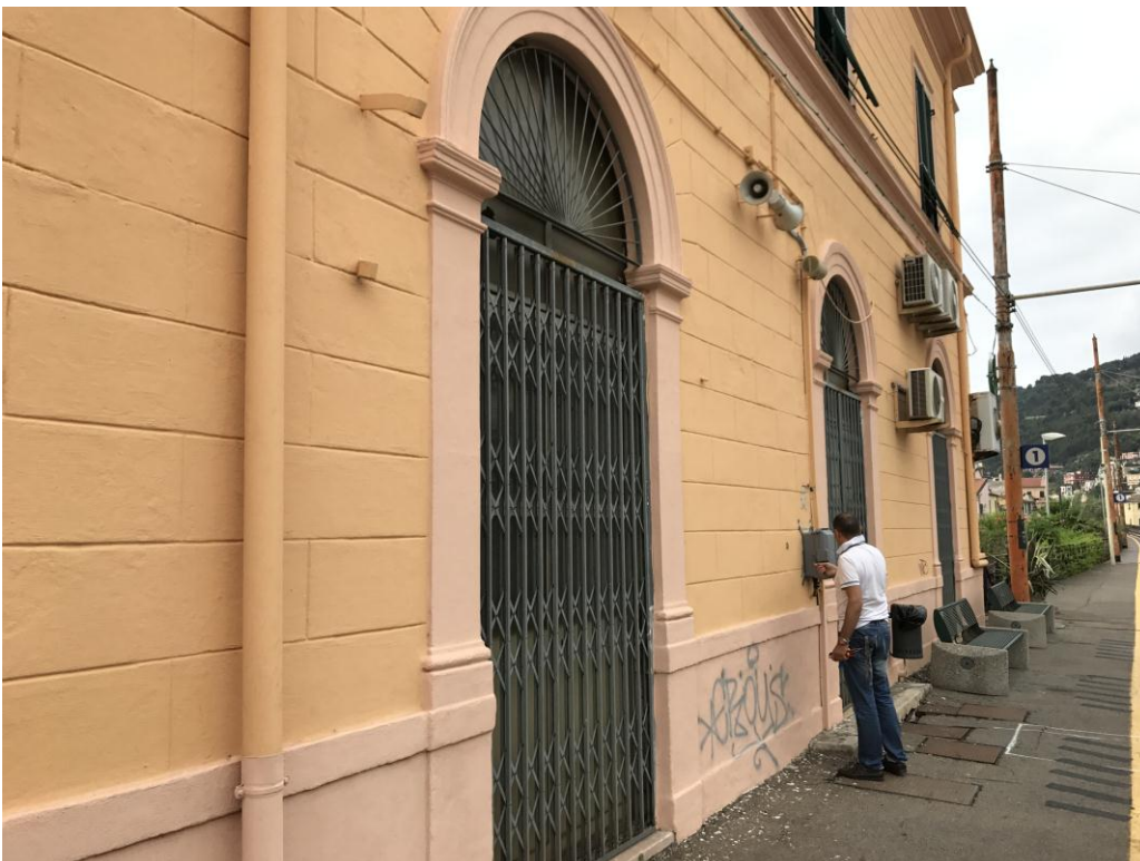
R1 – relazione analisi stato di fatto e scelte conservative

La facciata risulta decorata con falso bugnato dipinto e presenta le caratteristiche cornici marcapiano e marca davanzali e di questa tipologia di immobili e alcuni elementi plastici decorativi, quali lesene e paraste e portali che occorre conservare. Gli interventi oggetto della presente proposta progettuale non dovranno andare ad intaccare o manomettere tali aspetti esterni plastici e decorativi.