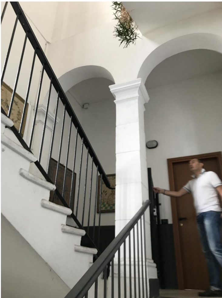
Foto 06 il vano scala

L'accesso al complesso avviene attraverso il vano scala interno a cui si accede dal lato corto dell'edificio a livello dell'Aurelia attraverso un portoncino in alluminio anodizzato di fattura moderna ma tipologicamente congruo con l'edificio , materiale moderno ma colore e forme congrue con la tipologia oggetto di analisi. All'interno del vano scala si evidenziano ancora alcune caratteristiche originarie nelle forme e nei materiali da conservare, se pur non è riscontrabile presenza di decorazione muraria, si consiglia di lasciare inalterati tali spazi degni di conservazioni, infatti anche in questa zona non verranno eseguiti interventi manutentivi.