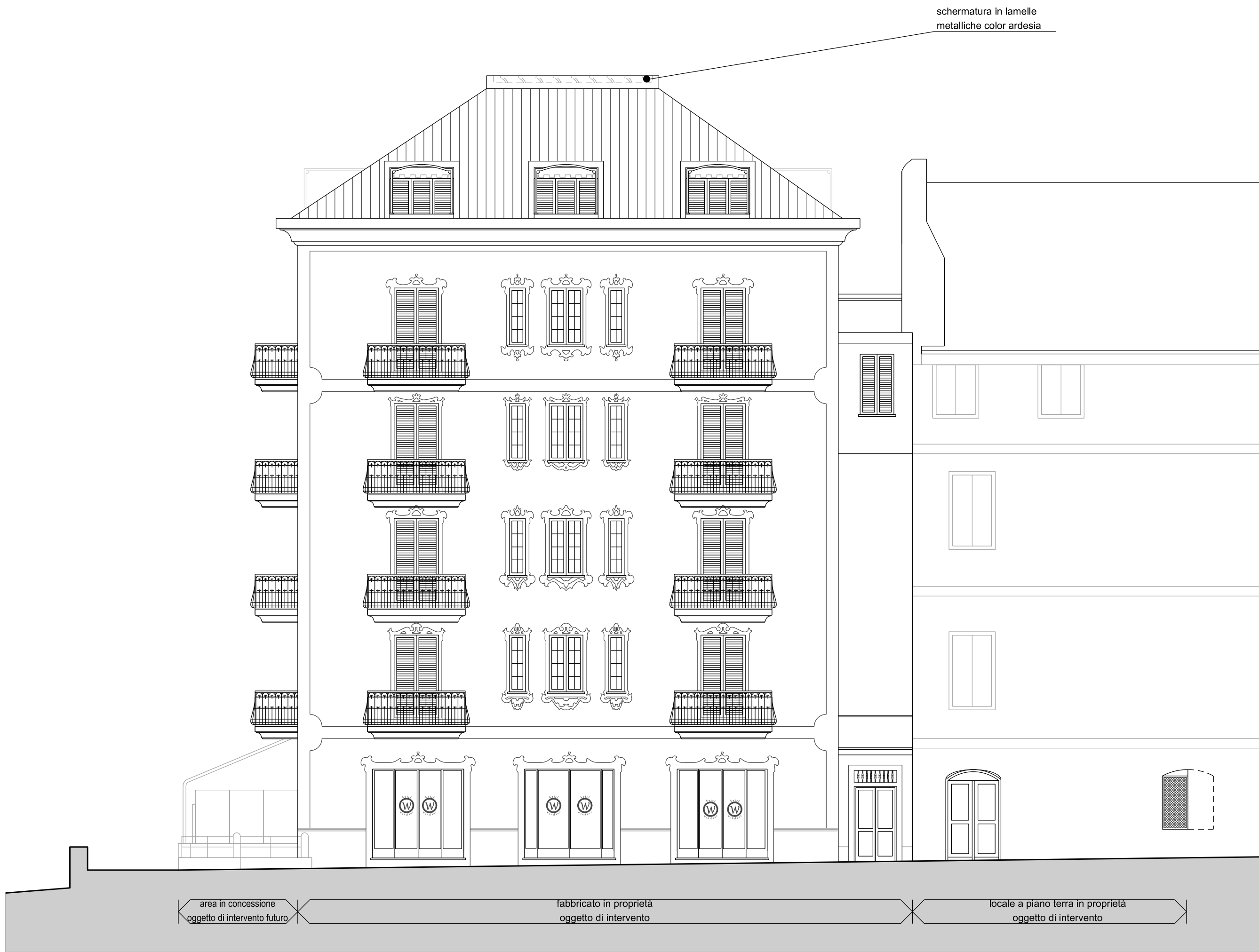
prospetto nord fronte principale (tavola III Re.L.)