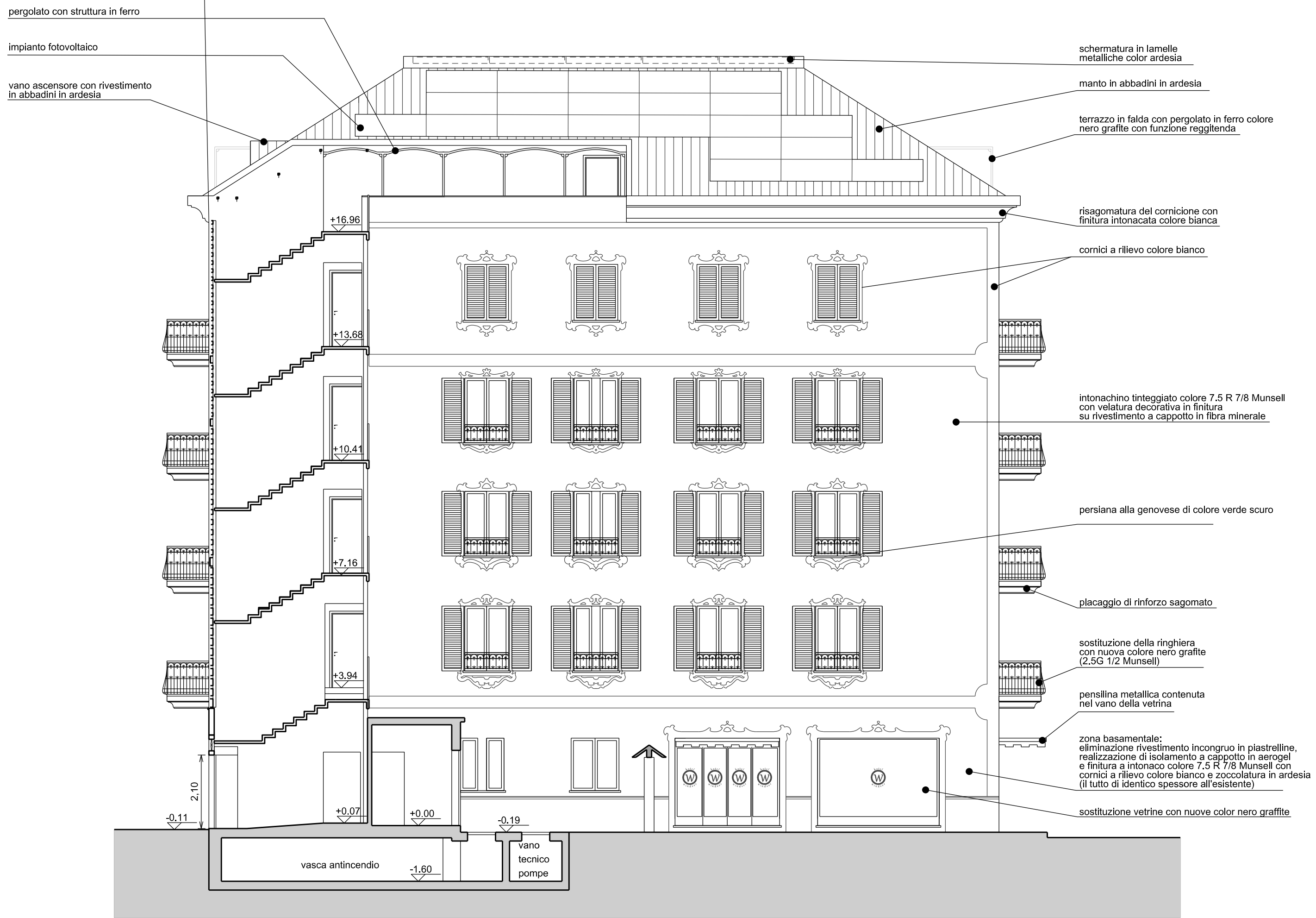
prospetto ovest fronte secondario (tavola III Re.L.)