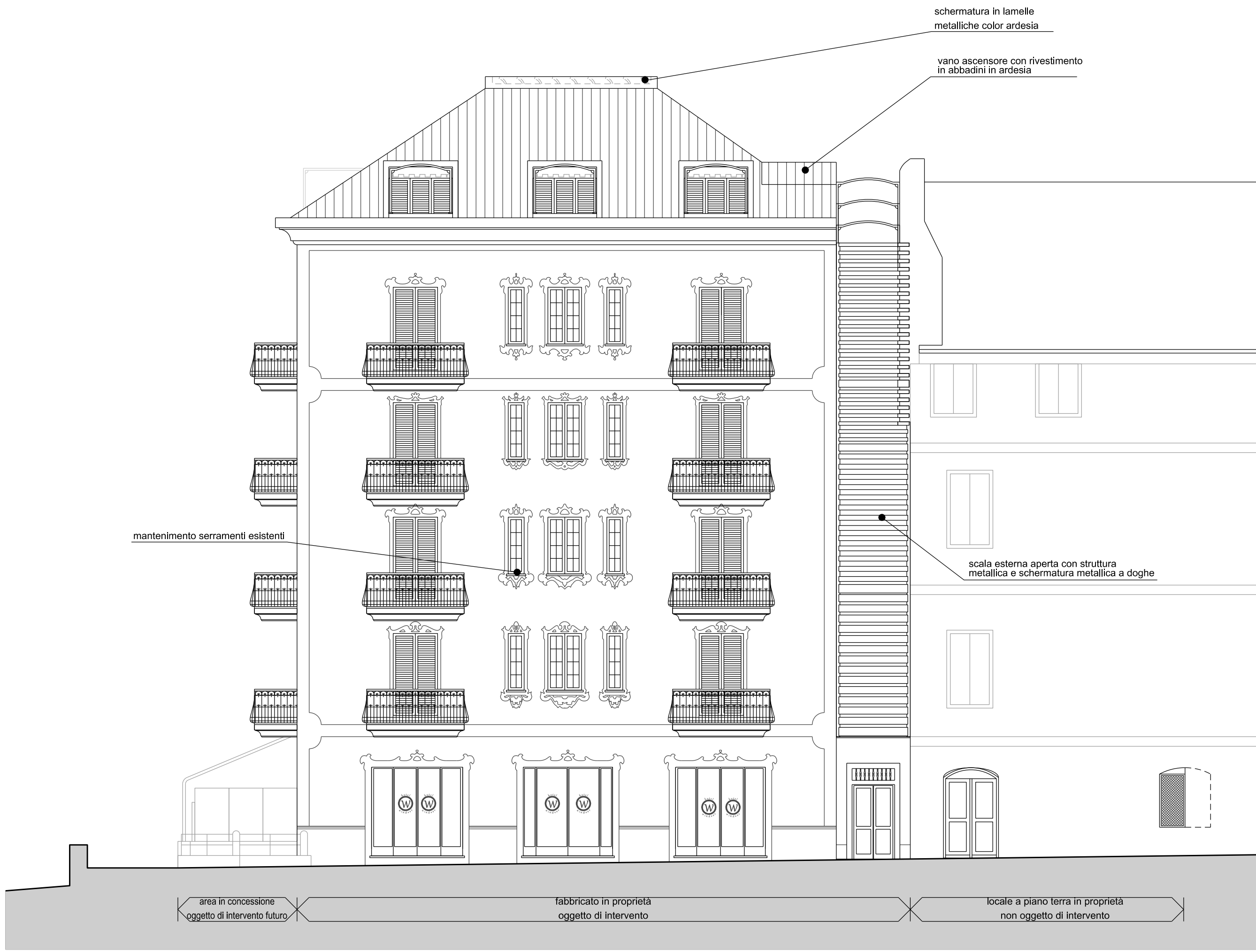
prospetto nord fronte principale (tavola III Re.L.)