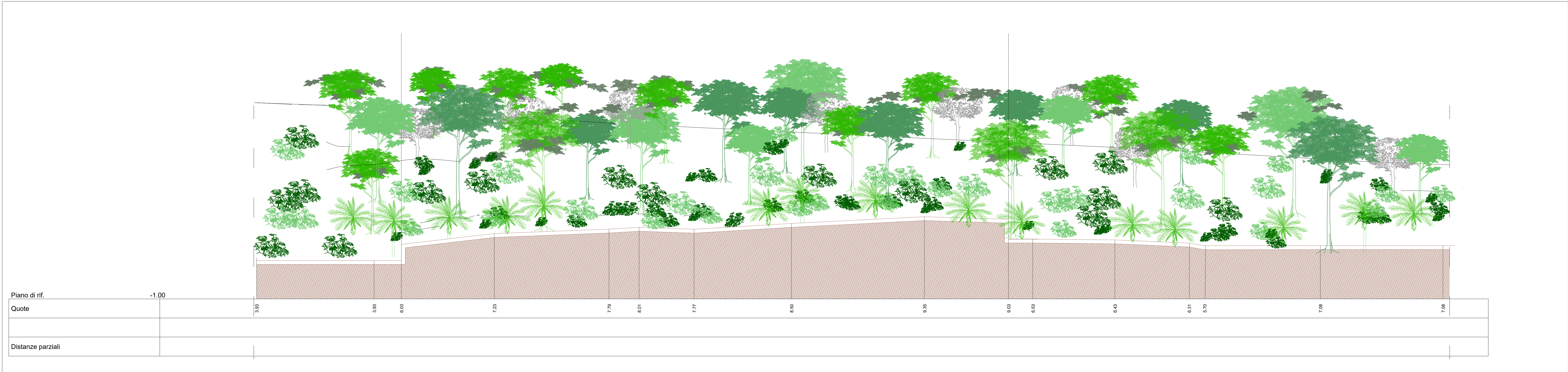
Sezione G-G' scala 1:200